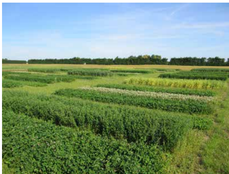
Forsøgsareal med produktion af mobil grøngødning, Årslev.